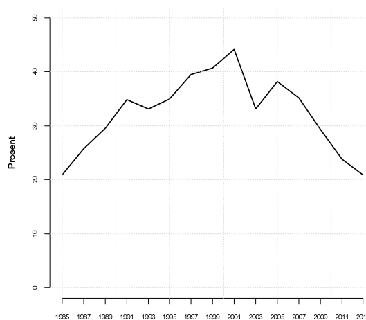
Figur 2: Andel unge (15-20 år) som opplyser at de spiller fotball, Norsk Monitor. 2

NFFs tall viser at antall medlemmer i norsk fotball har vokst kraftig fram mot 2002, sunket noe, for deretter å stabilisere seg. Tall fra Norsk Monitor viser at andelen unge fotballspillere i alde-